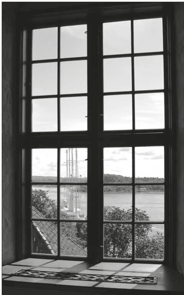
Från Akershus, Oslo.

att de är frigjorda. De som missbrukar den nyvunna friheten tolkar då friheten från lagen till att betyda frihet till att synda.