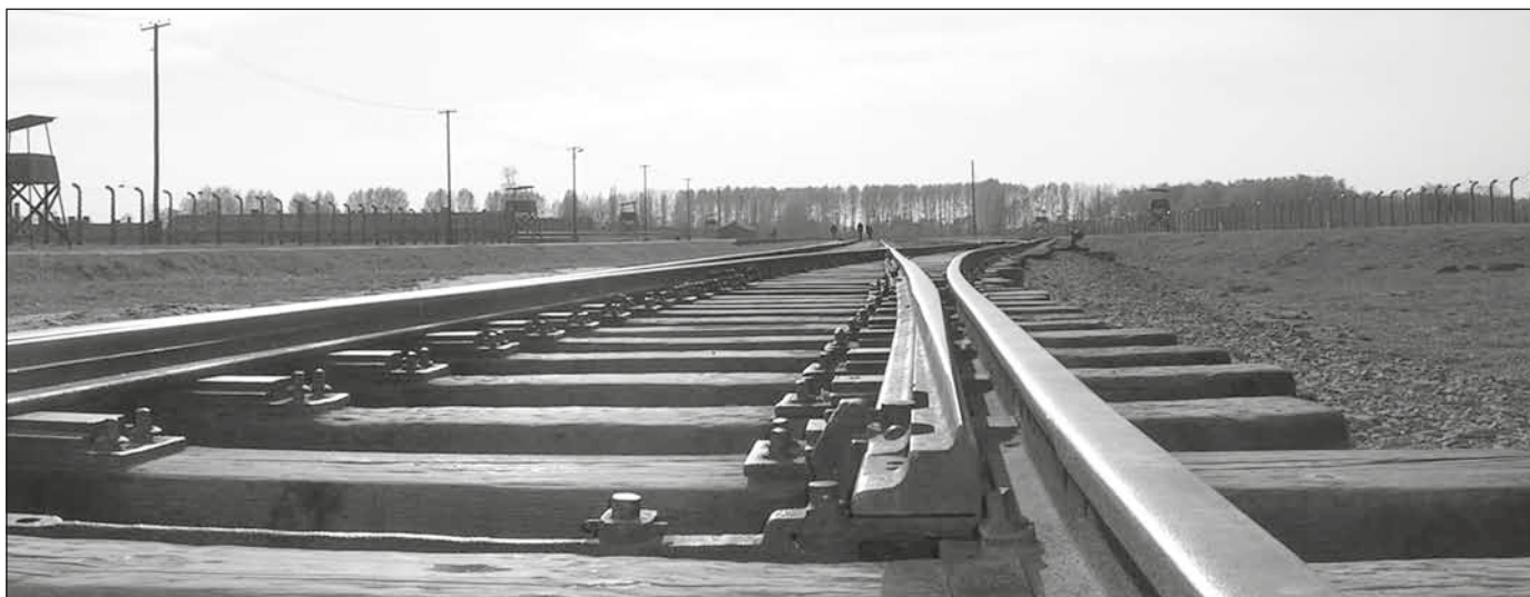
En väg till livet och en till döden. Från koncentrationslägret Auschwitz i Polen.

Döden tar människan till en plats med evig pina. Hon kommer att leva i bästa välfärd där, men samtidigt aldrig bli av med den intensiva