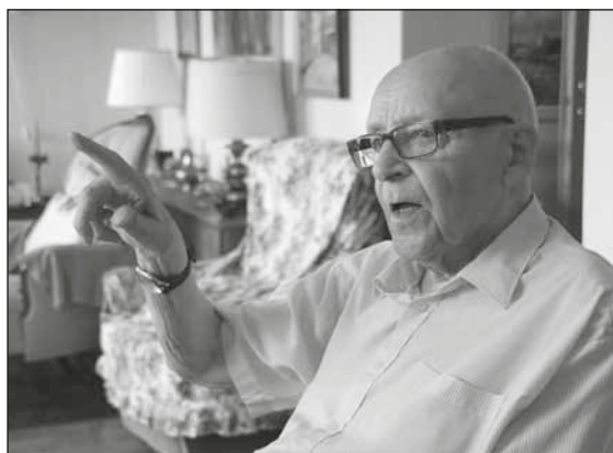
I hemmet i Borgå i juli 2010.