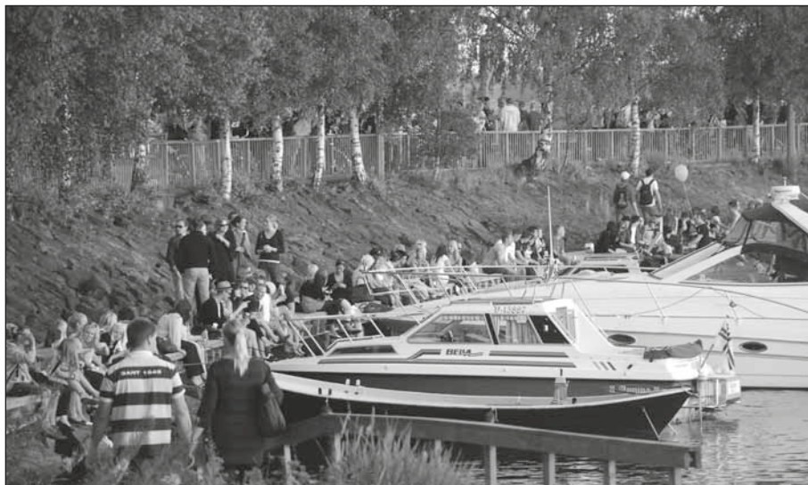
Från folkvimlet under Konstens natt i Vasa 6.8.2009. Bilden är från Inre hamnen.

Människosonen har kommit för att uppsöka och frälsa det som var förlorat. (Luk. 19:10)