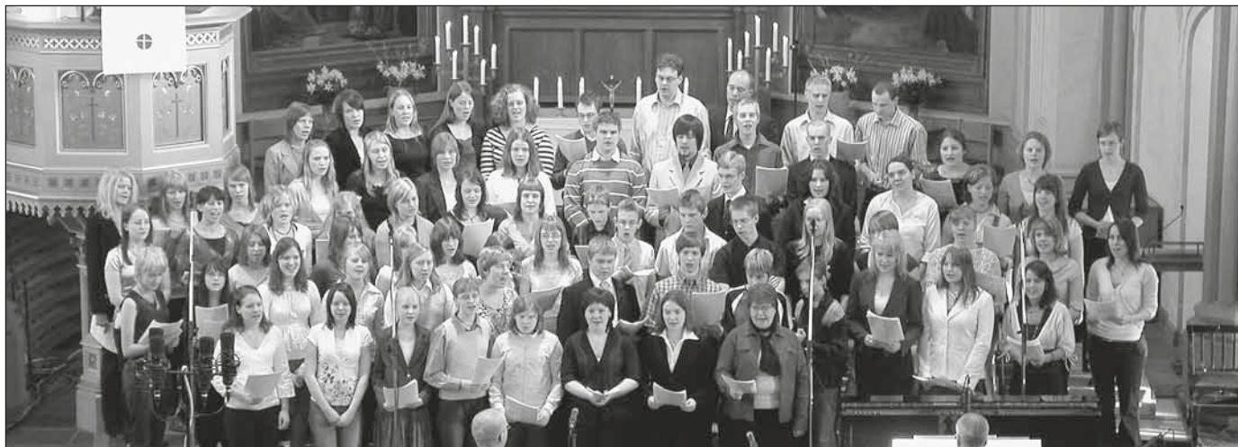
Ungdomskören Evangelicum har haft en stark genomslagskraft som redskap för evangeliet under många decennier. Bilden är från påskmusik i Trefaldighetskyrkan i Vasa 2006.

Efter tal och bön så kommer vanligen en ny session med "lovsång" som inte sällan kan vara ytterligare en halvtimme eller mer. Den plats man ger olika inslag under ett kristet möte, visar vilket värde man sätter på dem. Vad säger det som här har påpekats om vilket värde man sätter på förkunnelsen?